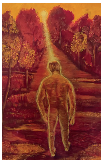
Morti bianche, 2011