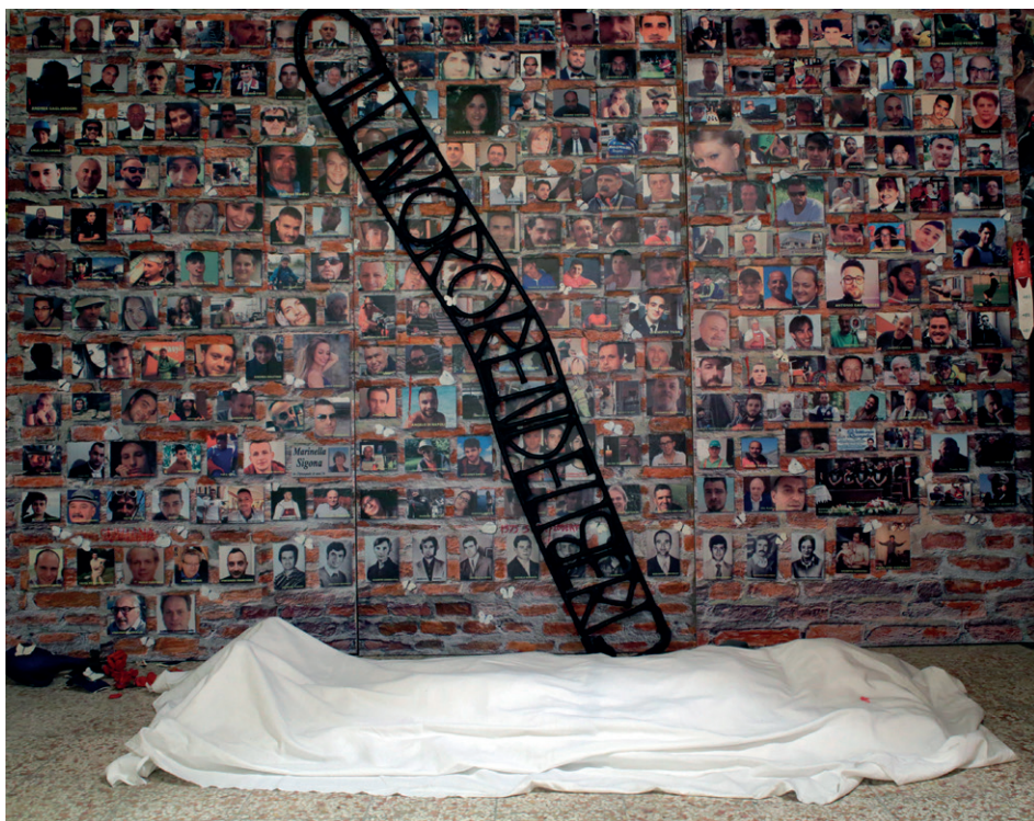
Il muro delle farfalle bianche, 2023