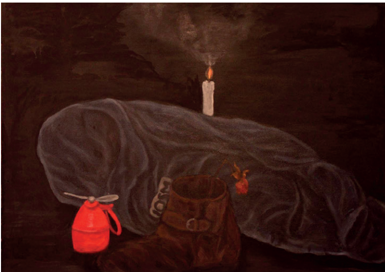
Si spengono le tute blu, 1983