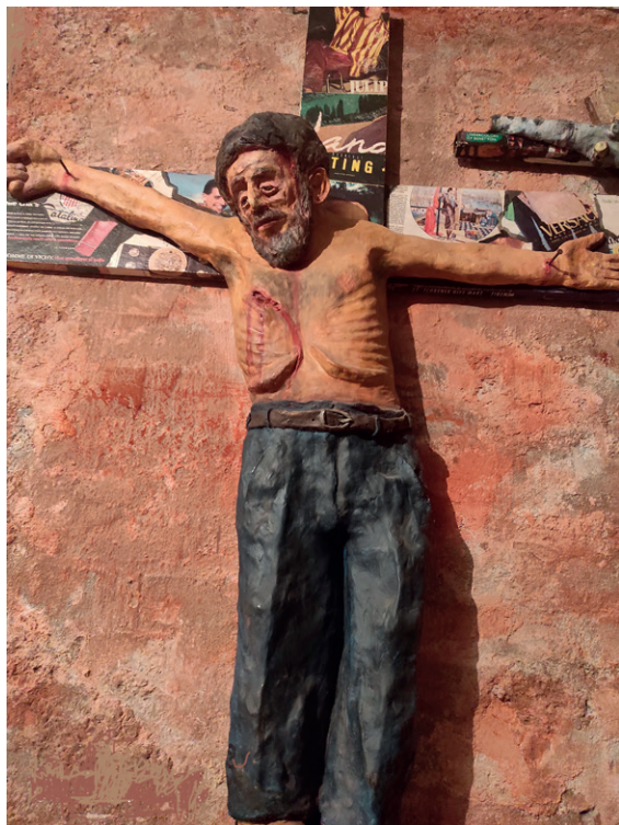
Cristo operaio con pubblicità, 1988